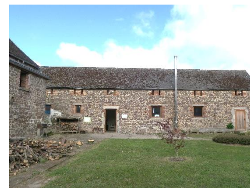
Magasin à la ferme et future conserverie

Dans le cadre de sa formation en maraîchage agroécologique, la Régie ambitionne de créer une conserverie afin de transformer et conserver ses productions de légumes (serre de 400m 2 et 60 ares de potager), et fruits issus de ses vergers. Ce nouvel outil contribuera à élargir les compétences des stagiaires, à diversifier l'offre de formation en attirant de nouveaux profils de demandeurs d'emploi, dont des femmes. Accessible aux associations et au public, l'atelier de conserverie sera un véritable outil de sensibilisation à l'alimentation saine et durable, et de cohésion sociale. L'espace réservé à cet effet accueillera le magasin à la ferme de la Régie.