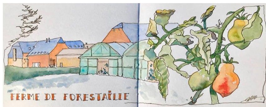
Aquarelle Alain Lefebvre