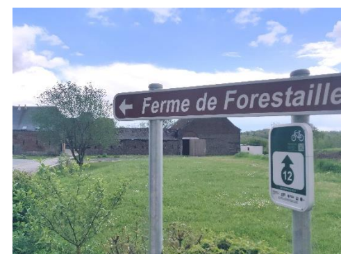
Un lieu idéal pour se ressourcer, à 300 m du chemin de halage