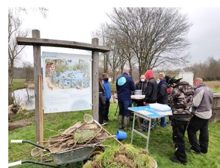
Contrat Rivière Sambre et Affluents asbl

Comme en permaculture, nous mettons en lumière l'habitat, le savoir-faire, l'enseignement, la santé, l'économie locale et la gouvernance. La formation en régie est à la croisée de la transmission, du savoir et de l'écoute.