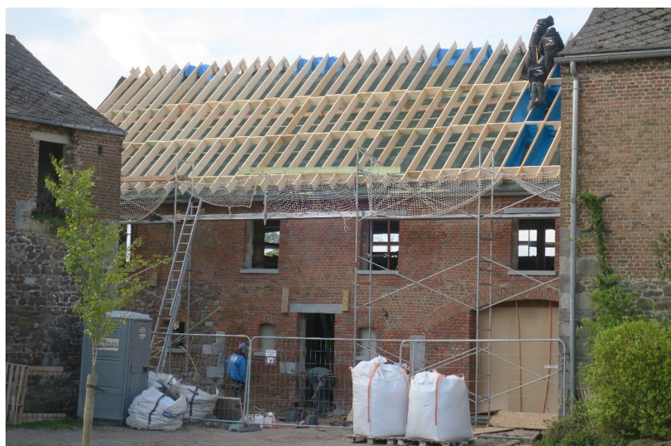
Réhabilitation d'une ancienne étable

Et dès qu'elle a pu, la Régie a repris sa présence au marché hebdomadaire de Lobbes. Les mesures anti-covid mises en place et respectées par les équipes ont permis de poursuivre nos activités en toute sérénité et au final, de garder le sourire derrière les masques.